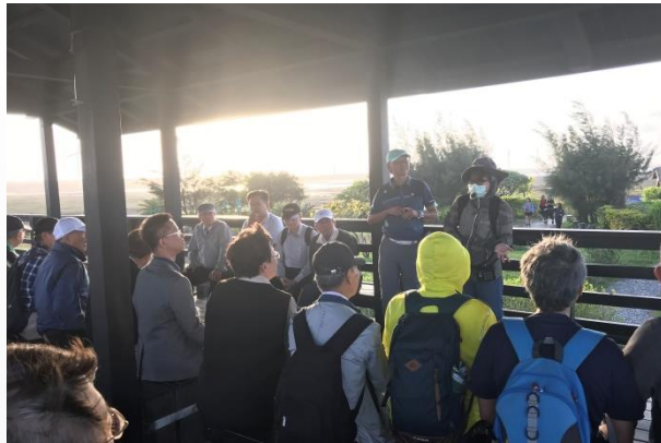
理監事們排排坐聆聽高美濕地導覽說明