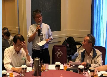
學生委員會謝理事